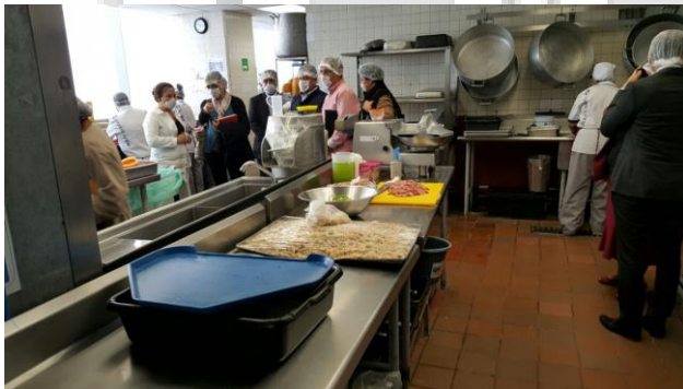
FOTO 1 RECORRIDO COMEDOR SAN JUÁN

A continuación, les presentamos algunas fotografías de los recorridos realizados en el interior de los comedores, las cuales muestran desde el tipo de productos, el etiquetado y organización de los mismos, la limpieza de las instalaciones, los elementos de protección y control de higiene del personal, así como la desinfección de verduras y ensaladas.