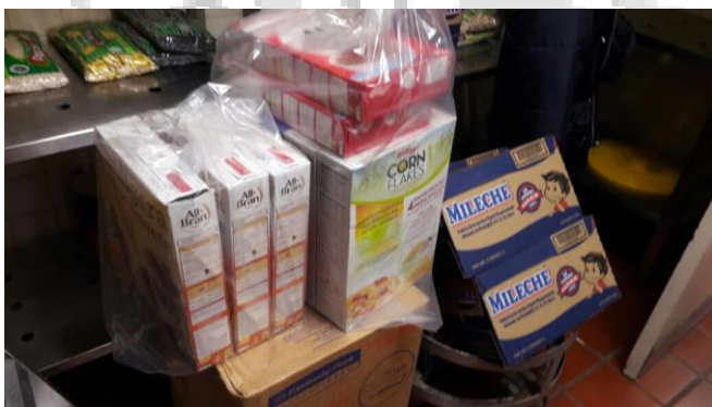
FOTO 3 PRODUCTO DE MARCA