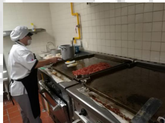
FOTO 4 PREPARACIÓN DE ALIMENTOS