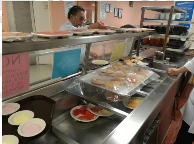
FOTO 2 LINEA DE ATENCIÓN COMEDOR LINDAVISTA