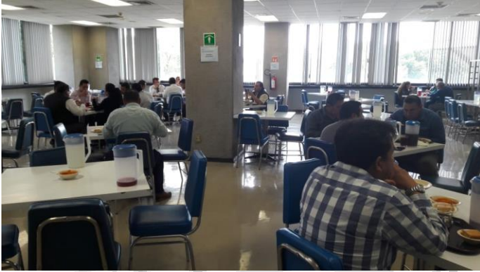
USURIOS DE COMEDOR ROJO GÓMEZ

A continuación les presentamos algunas fotografías de los recorridos realizados en el interior de los comedores, las cuales muestran desde el tipo de productos, el etiquetado y organización de los mismos, la limpieza de las instalaciones, los elementos de protección y control de higiene del personal, así como la desinfección de verduras y ensaladas.