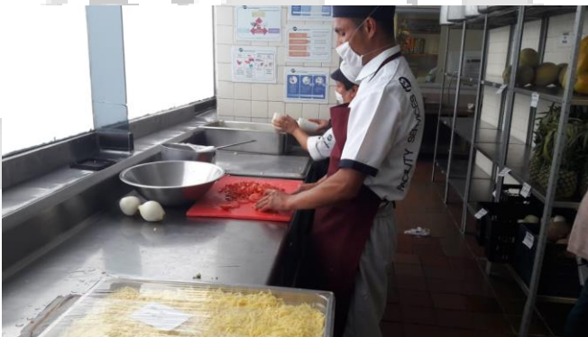
ELABORACIÓN DE ALIMENTOS